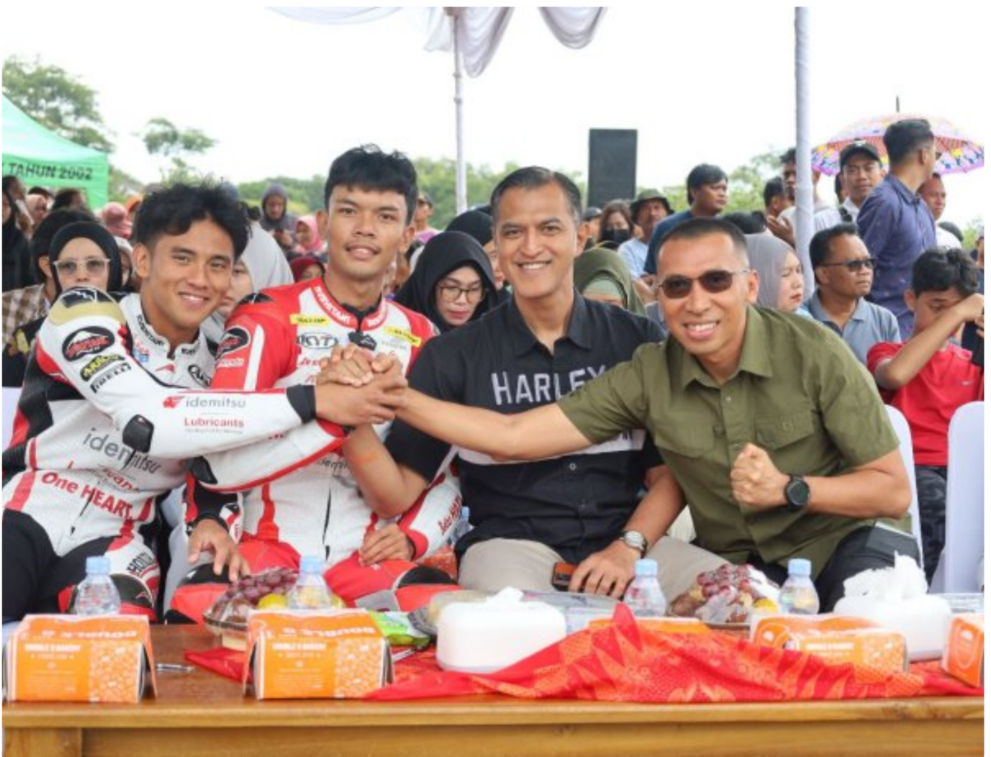
Dandim 0804/Magetan Hadiri Undangan Tinjau Sirkuit Magetan